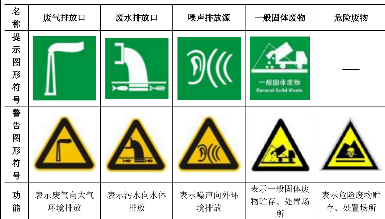
表 38 排污口（源）标志牌设置示意图一览表