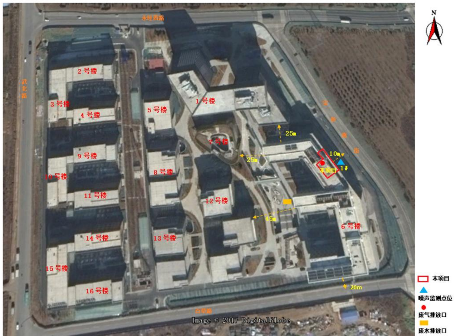
附图2 项目周边关系示意图