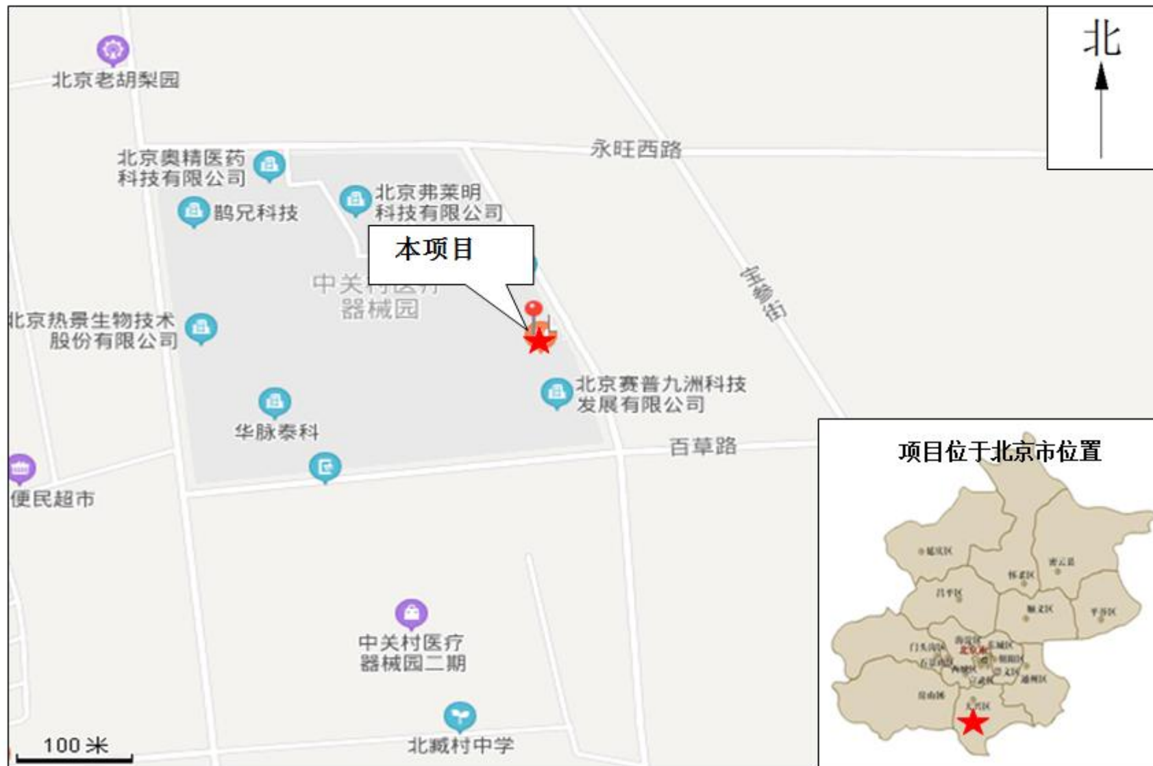
附图1 项目地理位置示意图