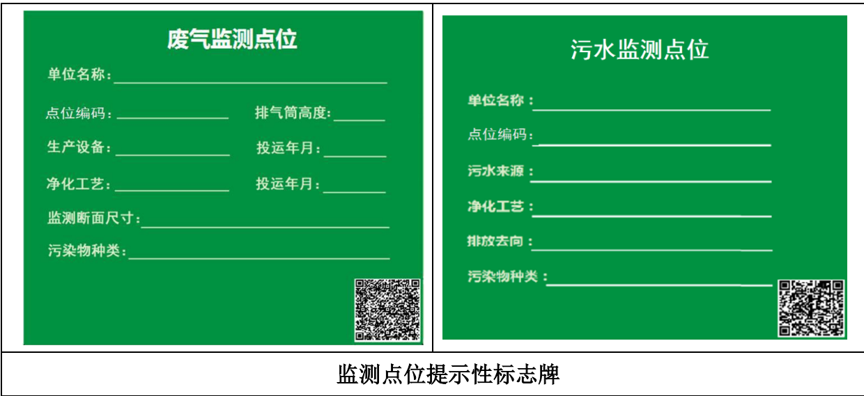
表 39 各排污口监测点位标志牌设置示意图一览表

①排污单位应建立监测点位档案，档案内容应包括监测点位二维码涵盖的信息、监测点位的管理记录、包括标志牌的标志是否清晰完整，监测平台、监测爬梯、监测孔、自动监测系统是否能正常使用，排气筒有无漏风、破损现象等方面的检查记录。