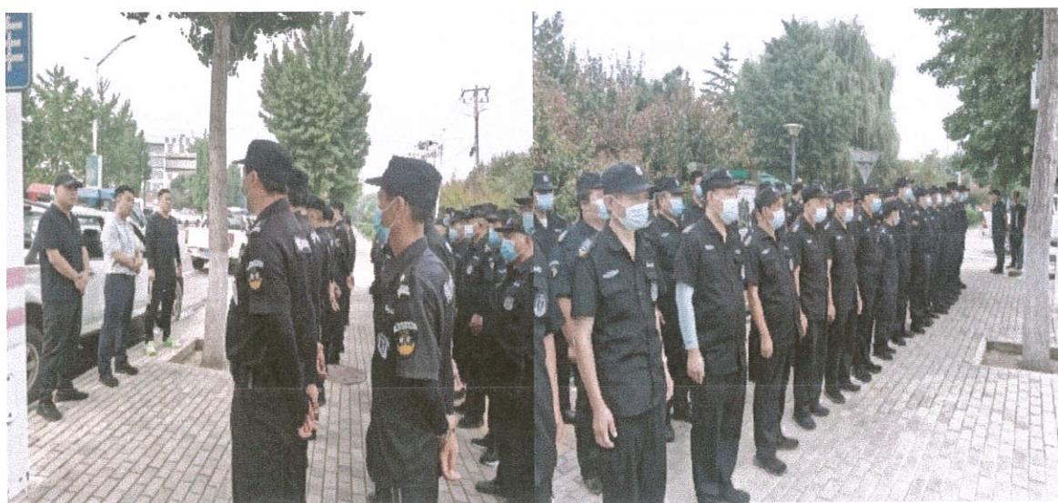
图 2 保安签到照片