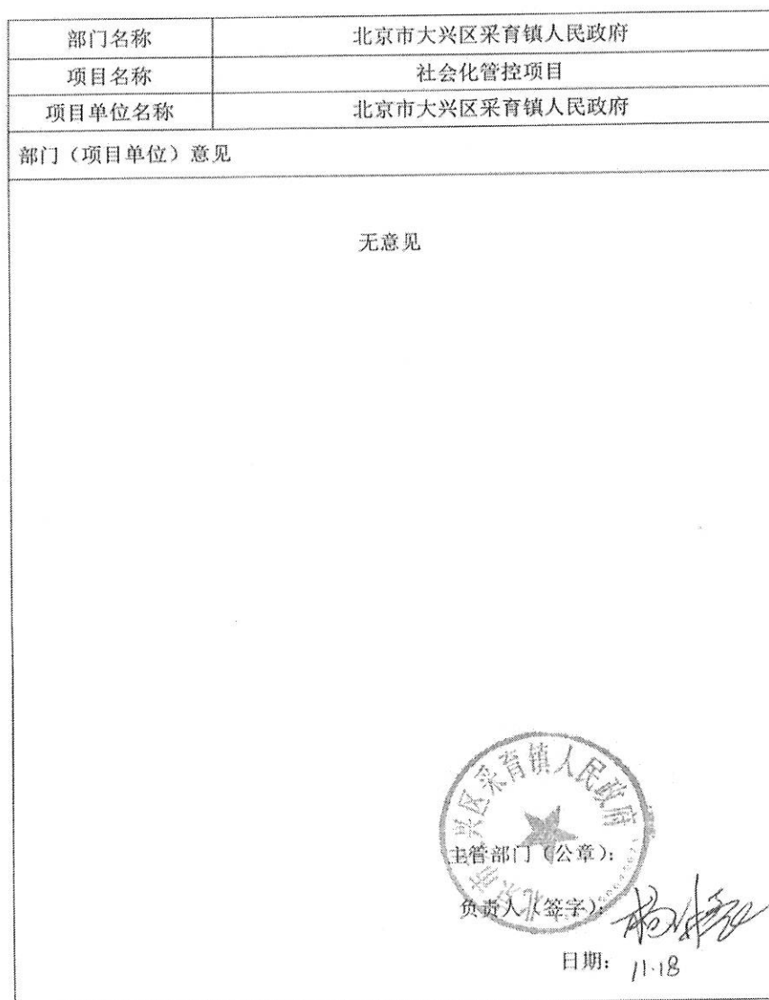
大兴区财政支出绩效评价报告意见反馈表