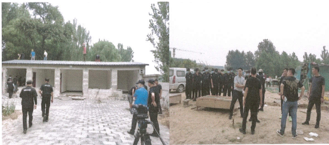
图 1 现场处理问题照片